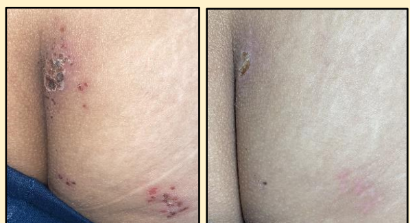
Figure2 : Zona interfessier